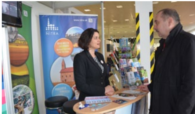
Mesto Nitra malo svoj stánok aj na medzinárodnom veľtrhu Nábytok a bývanie na výstavisku Agrokomplex.

du spolu s kultúrnymi a historickými zaujímavosťami. Významným dôvodom na návštevu Nitry je aj spojitost s minulosťou a maďarskou históriou. Maďari majú u nás viacero rodinných a príbuzenských vzťahov, kvôli ktorým k nám cestujú. (SY)