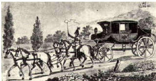
Poštový rýchlik z roku 1832.